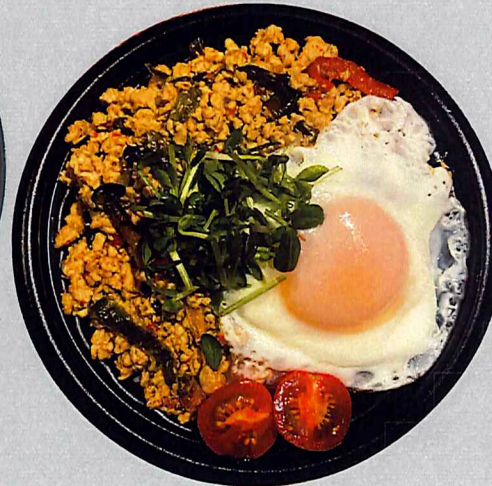
ガパオライス(目玉焼付)