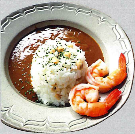
シーフードマサラカレー