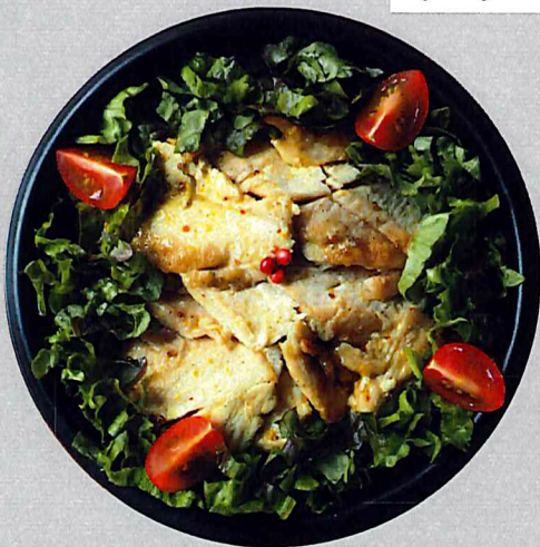
ハニーマスタード BBQチキン丼